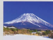
11-12月 富士ヶ嶺より富士山/山梨