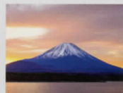
1-2月 本栖湖と富士山/山梨