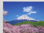
3-4月 岩本山公園より富士山/静岡県