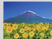
7-8月 山中湖村より富士山/山梨