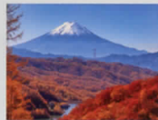
9-10月 大菩薩峠より富士山/山梨