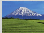
5-6月 大淵笹場より富士山/静岡県